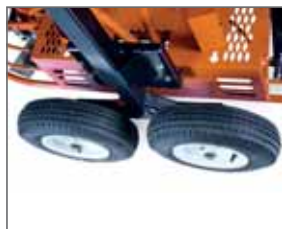
Transporträder 'Dolly jacks'