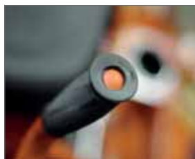
Elektrisches Spritzsystem im Handgriff