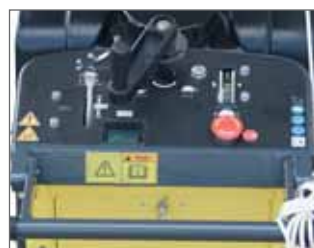
Modernes Bedienfeld mit Stundenanzeige