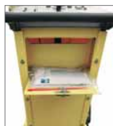
Fach für Unterlagen und Werkzeuge