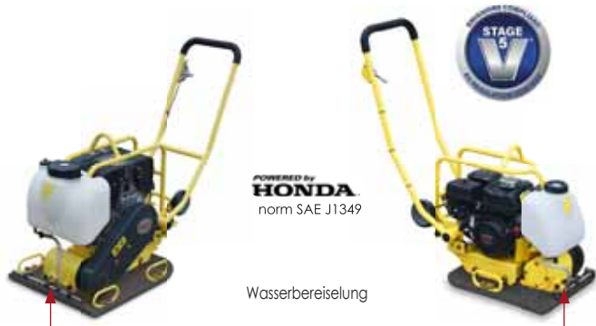
POWERED BY HONDA norm SAE J1349