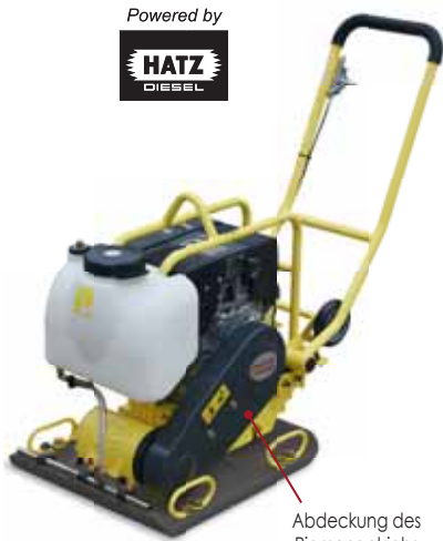
Abdeckung des Riemenantriebs