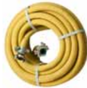
Mangueira para compressor Código : PAC-HOSE