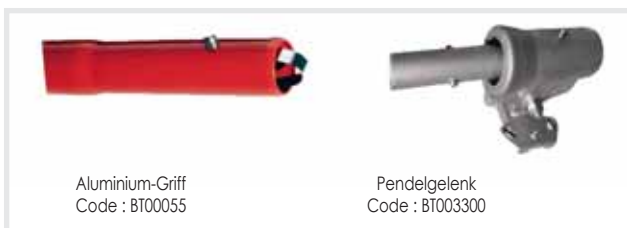
Aluminium-Griff Code : BT00055