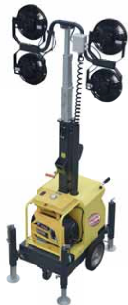
PLUG-IN & GO HYBRID