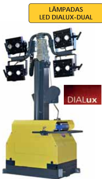
LÂMPADAS LED DIALUX-DUAL