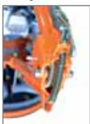
Braço rebatível com mola inovadora