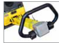
Gelagerter Handgriff und Servosteuerung