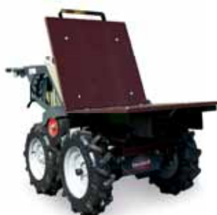
Flacher Aufsatz stets Teil der Ausstattung