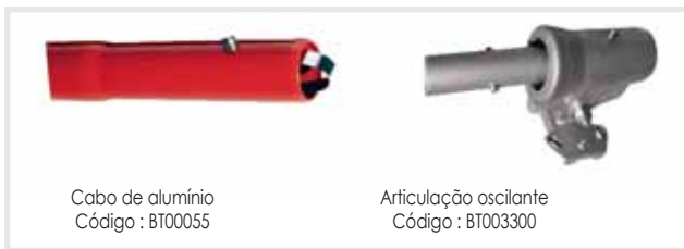
Cabo de alumínio Código : BT00055