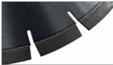
SEGMENTO ARIX Para betão armado ou reforçado

Lâminas de diamante de alto desempenho, mais rápidas e mais produtivas no mercado.