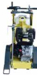
Wassertank 25 L