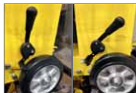
Sicherheitsbremse – CE-zertifiziert