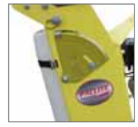
Max. Durchmesser 450 mm