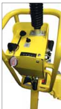
Poignée double amplitude