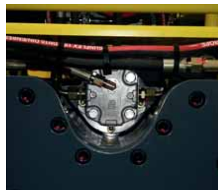
Moteur de vibration Sauer Danfoss