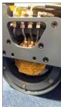
Deux pompes hydrauliques Poclairn