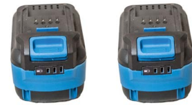
x 2 Batterien B1840