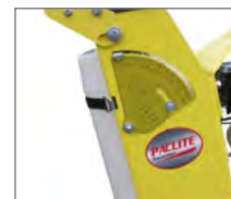
Diameter max. 450 mm