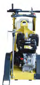
Vattentank 25 L