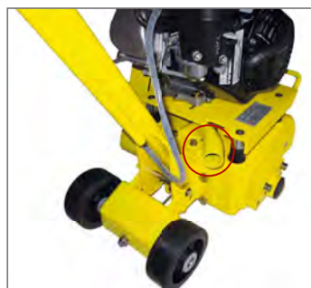
Uttag för dammsugare