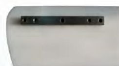
Polypropylenblad för epoxy