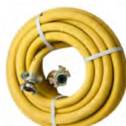
Kompressorns slang Kod : PAC-HOSE