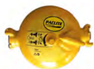
Tillbehör : extern oljebehållare Kod : PAC-LUB