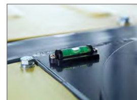
Vattenpass för marknivå