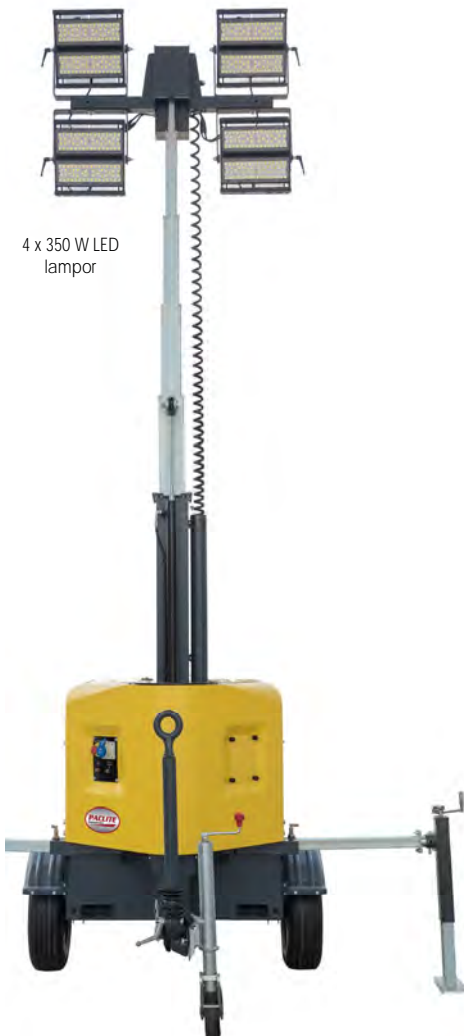
Platsbogsering eller vägtransport