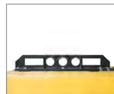
Gaffelfickor och lyftkrokar för enkel lastning för transport