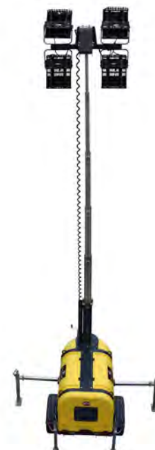
Trailer justerbar i höjdläge