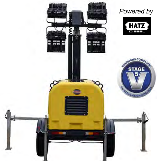
MANUELL EJ VÄG BOGSERING