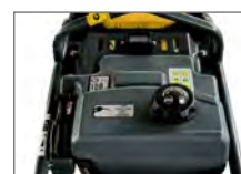
Digital varv & tidsmätare