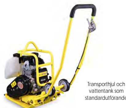
Transporthjul och vattentank som standardutförande