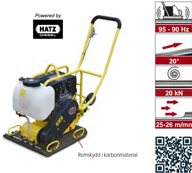
Remskydd i karbonmaterial