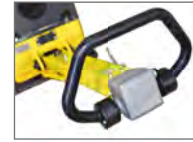
Vibrationsdämpande gummi handtag och steglös servostyrning