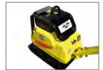
Alltid med elstart i standardutförande