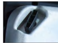
Extra manuell start