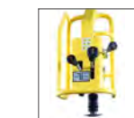
Låg hand-arm vibration.