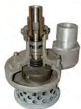
Núcleo de la bomba