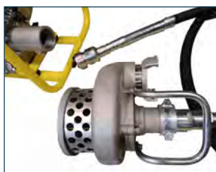
Acoplador rápido para el eje flexible