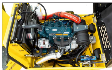
Motor turbo com maior potência