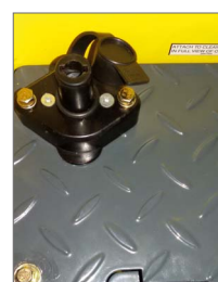
Sistema de bloqueio central para transporte, armazenagem e anti-roubo