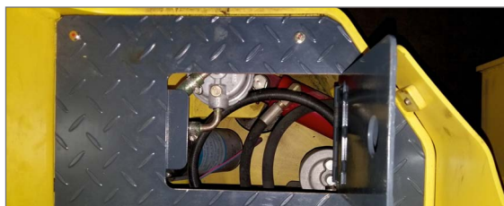
Acesso ao filtro