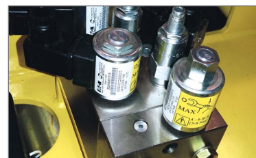
Sistema hidráulico em linha que melhora a segurança e o funcionamento