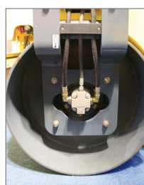
Sistema de vibração Casappa