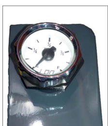
Mostrador de nível de água