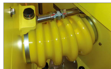
Articulação dupla com pontos de lubrificação de patente 'Pac-pivot'