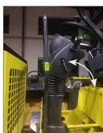
Volante ergonómico regulável