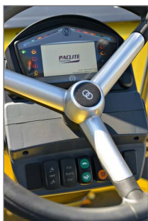
Concepção confortável e ergonómica

Potente motor de 3 cilindros de grande acessibilidade, baixo consumo de combustível e níveis de poluição reduzidos.