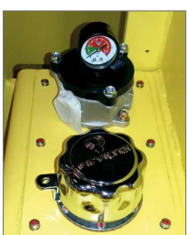
Manómetro de nível de óleo