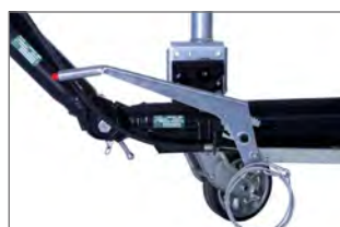
Opção: travão manual ajustável