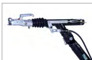
Opção: travões de reboque