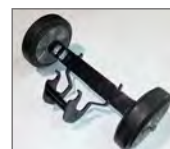
Opção rodas de transporte