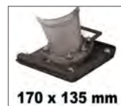
Sapata do saltitão intermutável