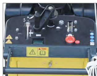
Panneau de contrôle avancé avec compteur d'heures