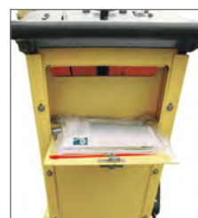
Boîte à outils et documents