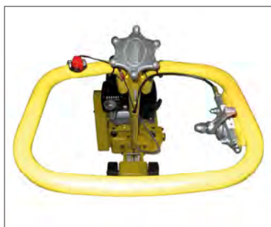
Poignée de guidage