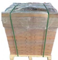
Palette de livraison

Les lames des taloches se montent sur des pales de finition pour augmenter la surface de contact.