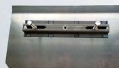
Pale mixte avec écrou flottant