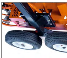
Roues de transport 'Dolly jacks'