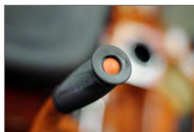
Système de pulvérisation électrique dans la poignée