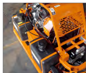
Deux réservoirs d'eau