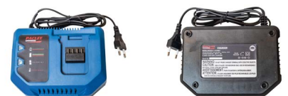
Chargeur de batteries C1860L

Valise de transport + 2 batteries + 1 chargeur de batterie