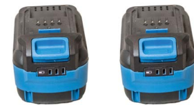
x 2 batteries B1840