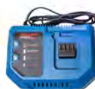
Chargeur de batteries C1860L

Valise de transport + 2 batteries + 1 chargeur de batterie