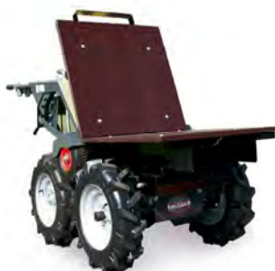
Plateau toujours inclus