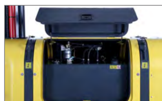
Capot d'ouverture, des composants en carbone pour réduire le poids