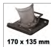
Pied étroit interchangeable