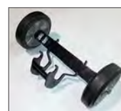
Option Kit roues de transport