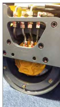
Deux pompes hydrauliques Poclair