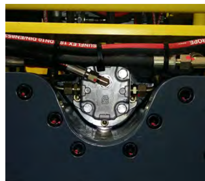
Moteur de vibration Sauer Danfoss