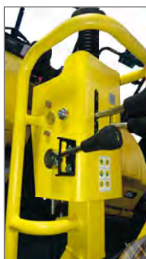
Poignée double amplitude

Excellente performance de compactage de tous nos modèles