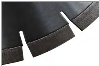
ARIX TEKNIK Extremt förstärkt material Grus, granit, armerad betong, stål.

ARIX TEKNOLOGI : betong-stål- armerad betong Med tandad kant. För en jämn kapning med skarpa kanter. ARIX är det ultiama bladet för de mest krävande användningar.