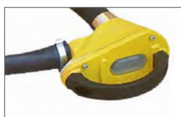
VX (D) version (ergonomiskt handtag för golv)

Tillverkad under standarder: EN 60745-2-12:2003 EN 60745-1:2003