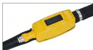
PACLITE förbättrar komponentkvaliteten och testas till gränserna! ERP isolerad polyuretan överdragen mjuk hydraulisk slang som inte stelnar i kyla kabel "Top flex".