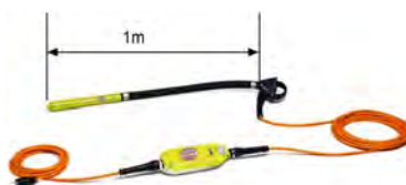
TILLVAL: Vulcollan ändstycken, för arbete i kontakt mot armeringsjärn Speciallängder på 8 eller 10 meter av slangen finns att beställa