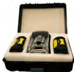
Bärlåda för två batterier och snabb laddare. Ett batteri inkluderas per maskin (extra batteri som tillbehör).

Förpackade och märkta enligt de direktiv MSBFS 2016:8.