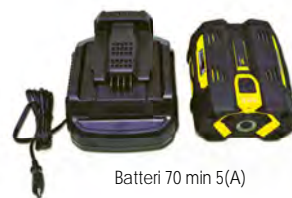
Batteri 70 min 5(A)