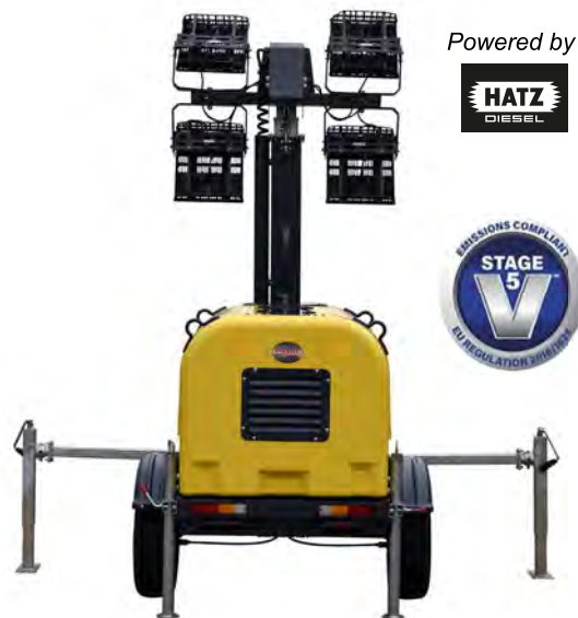
MANUELL EJ VÄG BOGSERING