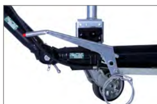
Trailer justerbar i höjdläge