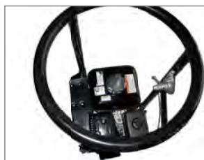
Gasreglaget monterat lättillgängligt