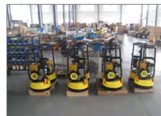
Monterad i stora serier