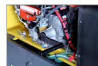
Elstart med manuell nödstart i standardutförande