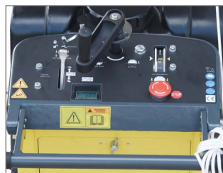
Avanzado tablero de controles con medidor de hora