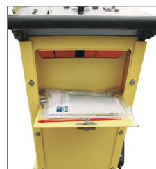
Caja para documentos y herramientas