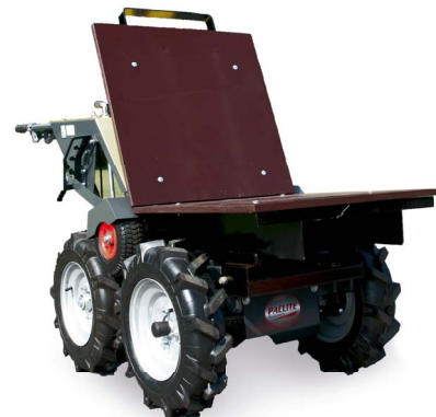
Bandeja plana siempre incluida