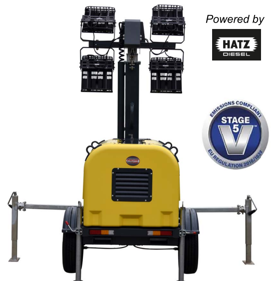
REMOLQUE MANUAL AL SITIO