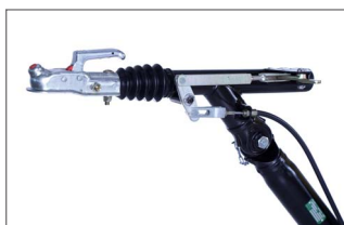
Opción: Frenos para remolcar