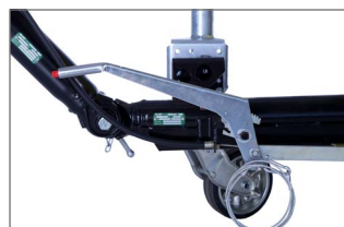
Ajuste manual del freno y altura