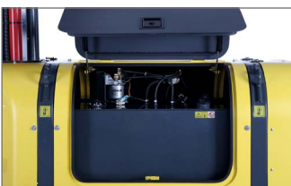
Cubierta de servicio, componentes de carbón para reducir el peso