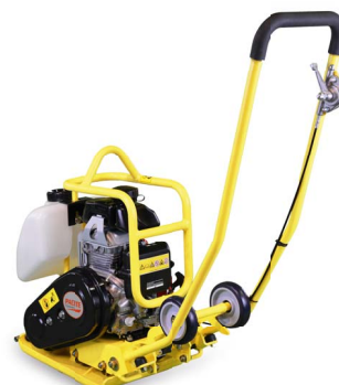
Ruedas de transporte