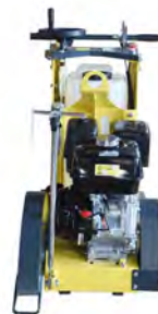
Réservoir d'eau 25 L