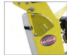
Diamètre lames 450 mm