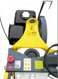
Point de levage central